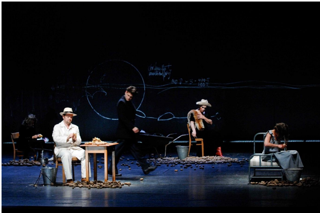
Abb. 3: „Der Hofmeister“