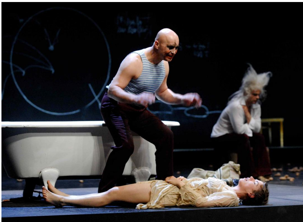
Abb. 4: „Der Hofmeister“

Ja, ich finde man spürt dann noch mehr, dass auch der Schauspieler einen Körper hat – die Figur und der Schauspieler –, das macht es noch sinnlicher.