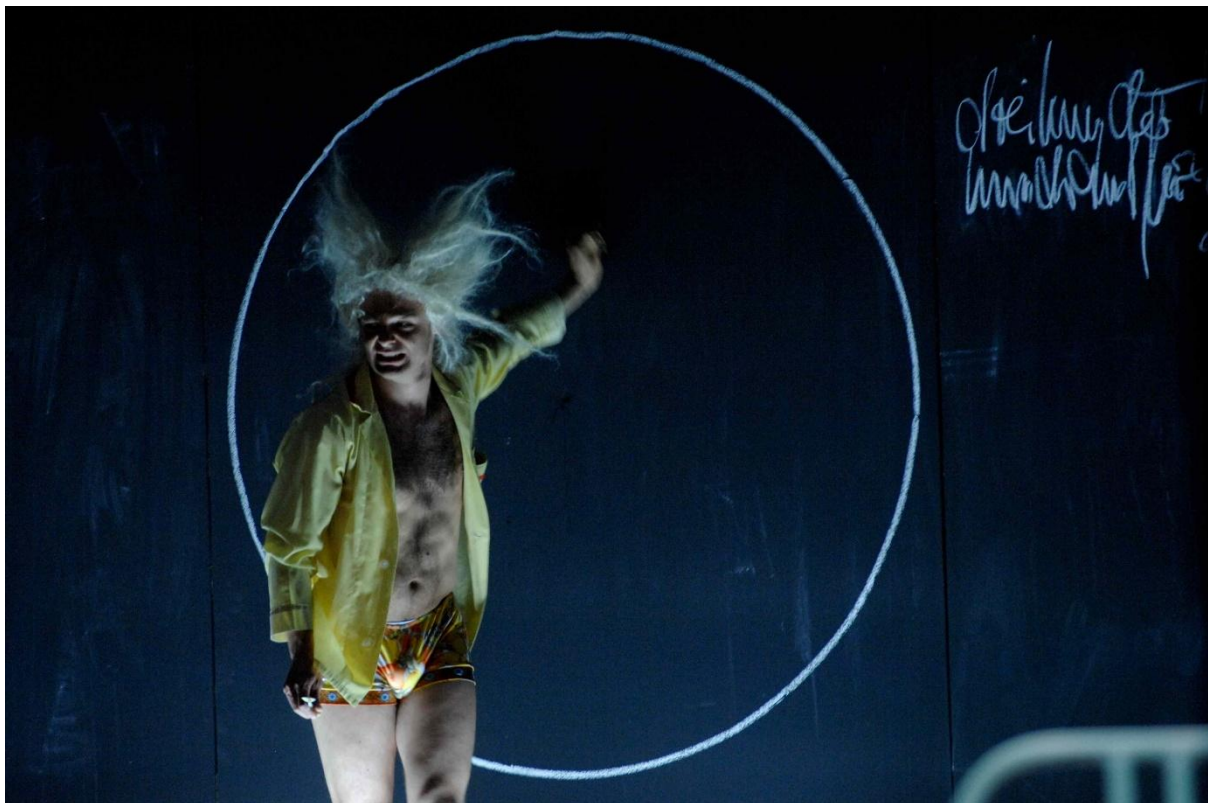
Abb. 5: „Der Hofmeister“