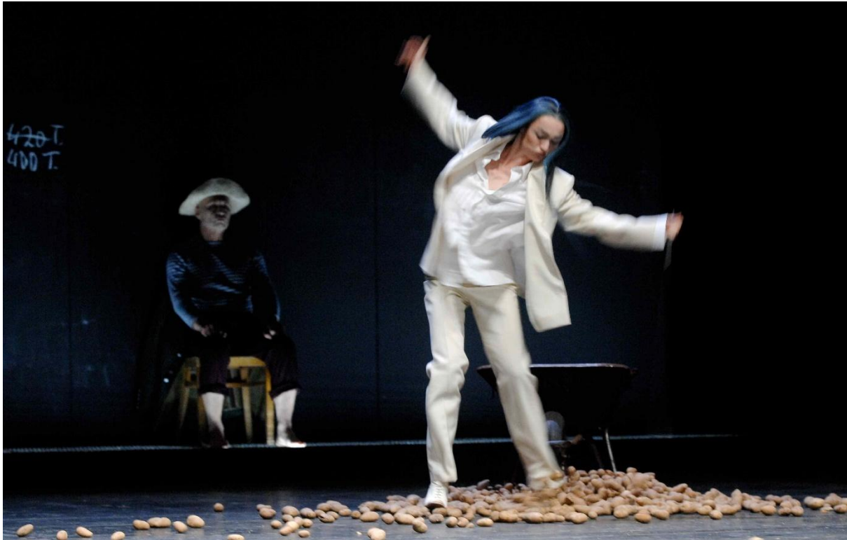
Abb. 7: „Der Hofmeister“, © Theater an der Ruhr, Foto: Andreas Köhring