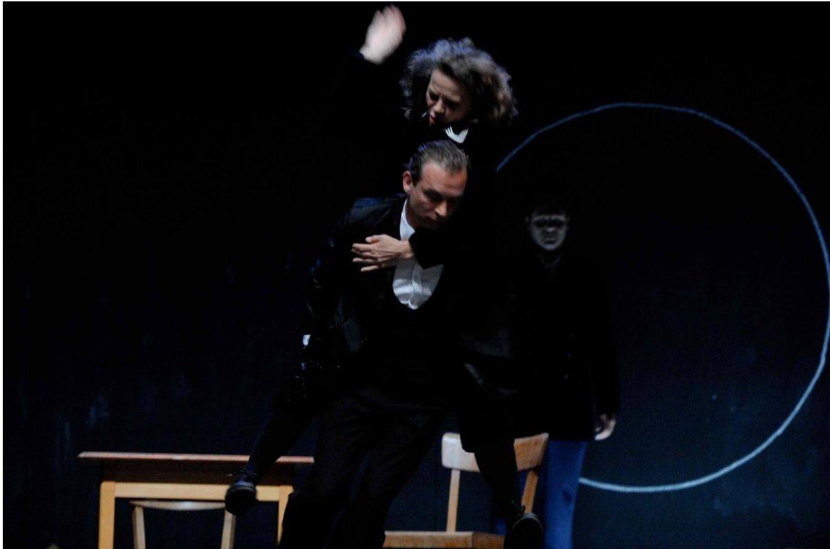
Abb. 6: „Der Hofmeister“