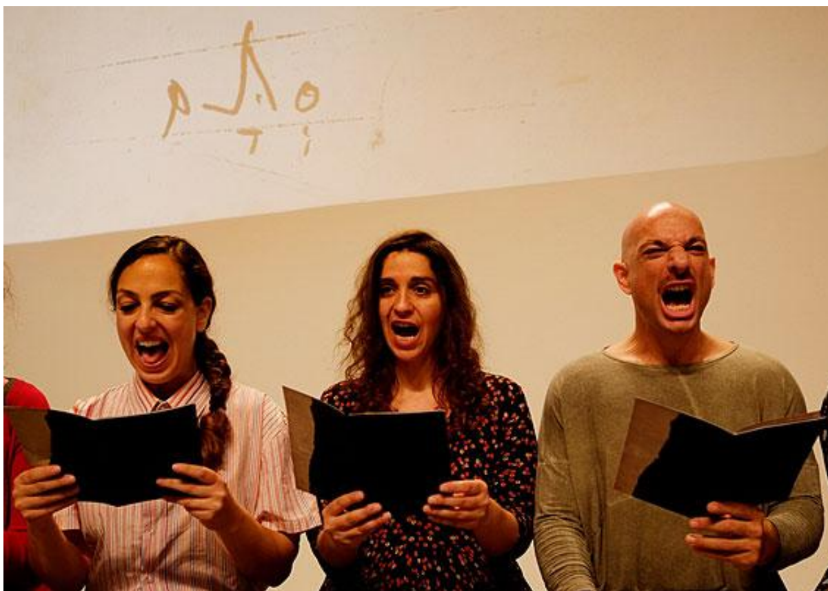
Fig. 4 The pupils are learning the word „stam“ (unbestimmt, the second word in the notebook.